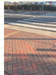
イオンモール堺北花田周辺の点字ブロックの新規設置