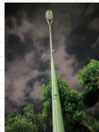
中百舌鳥駅周辺の街灯の改修