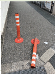
百舌鳥八幡駅周辺のポール改修