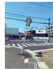
百舌鳥梅北町の標識の改修