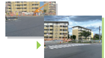
金岡公園周辺の横断歩道の改修